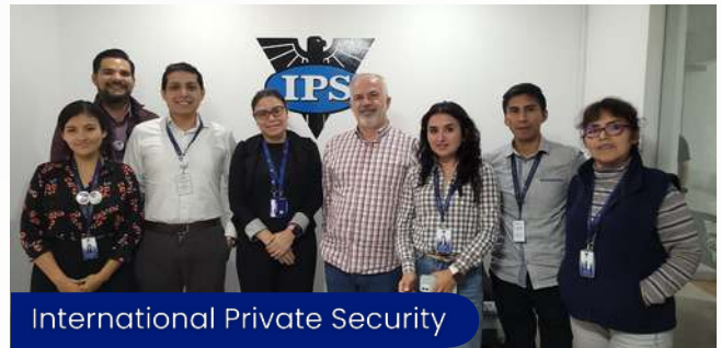
International Private Security