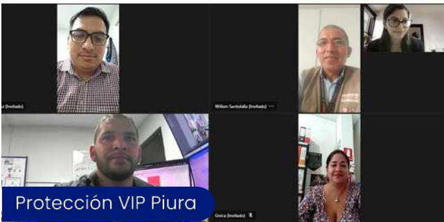
Protección VIP Piura