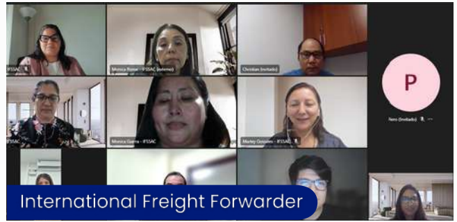
International Freight Forwarder