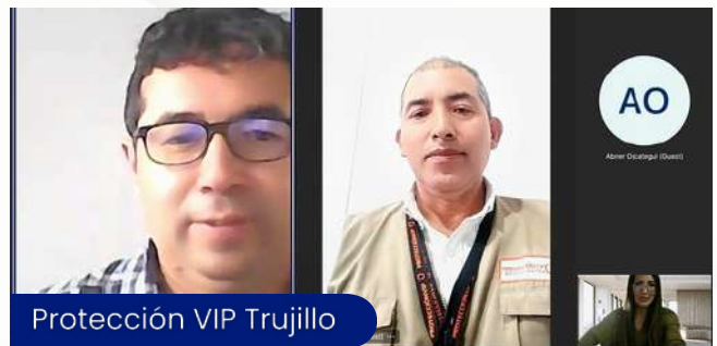
Protección VIP Trujillo